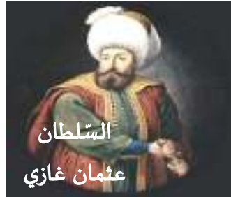
السُّلْطَان عثمان غازي

1) عرّف بالشخصيات الظاهرة في الصورتين: (01ن)