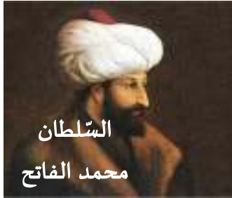
السُّلْطَان محمد الفاتح